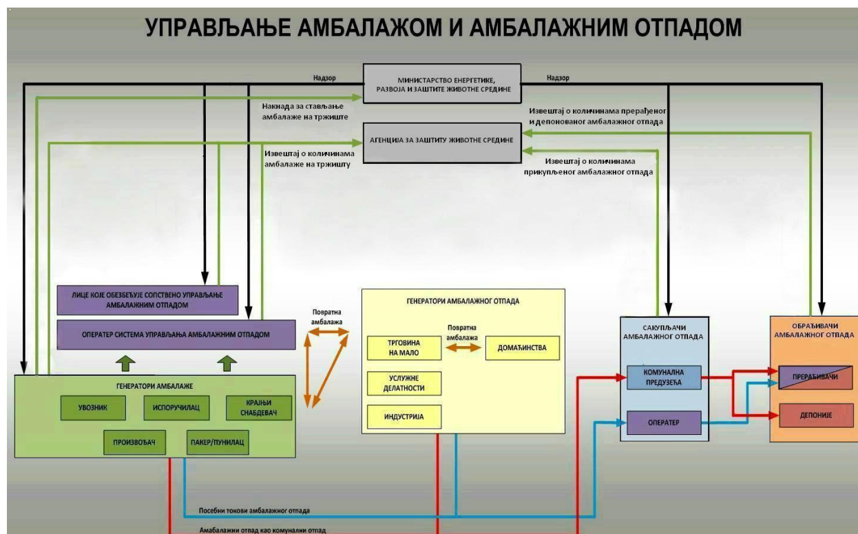
Слика 1. Систем управљања амбалажом и амбалажним отпадом у складу са Законом

Управљање амбалажом и амбалажним отпадом је дефинисано Законом о амбалажи и амбалажном отпаду (Сл. гласник РС, бр. 36/09) у даљем тексту - Закон. Предузећа која производе или управљају амбалажом и амбалажним отпадом имају обавезу да у свом раду поступају у складу са одредбама овог Закона и одговарајућим подзаконским актима, и о томе достављају годишње извештаје надлежним органима. Систем управљања амбалажом и амбалажним отпадом у складу са Законом је представљен на слици 2.